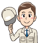
◎体制変更のモデル

お取引先企業様の有期雇用社員様を弊社の正社員としてお受け入れて雇用維持しつつ、同時に弊社へ同業務を委託することで運用コスト削減も実現できる解決プランをご提案しました。お取引先企業様の有期雇用者様の受入実施と並行して、弊社が運営する他職場から管理者を配転し、運営管理体制を整備しました。ご提案から弊社業務委託化への完全移行まで約7か月のスケジュールで実行しました。